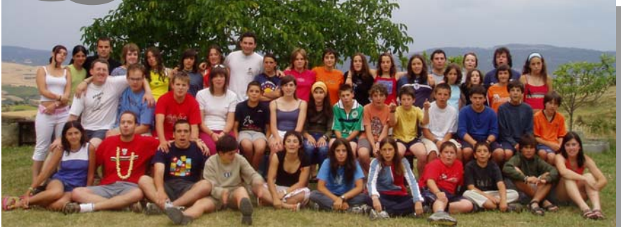
MuzKi' o4 AsTialDia